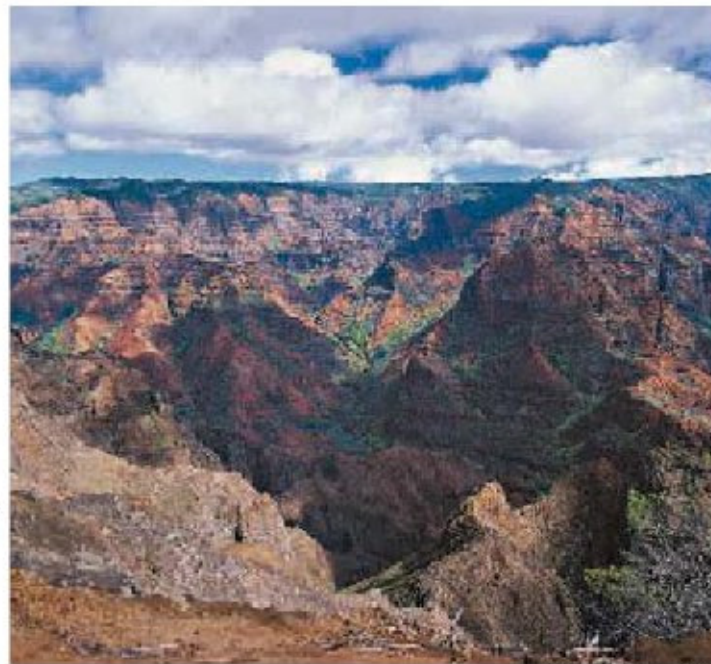
▲ Waimea Canyon, Kauai