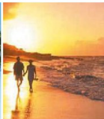
▲ Nuanu Pali Lookout, Oahu