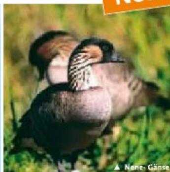
▲ Nene - Gänse