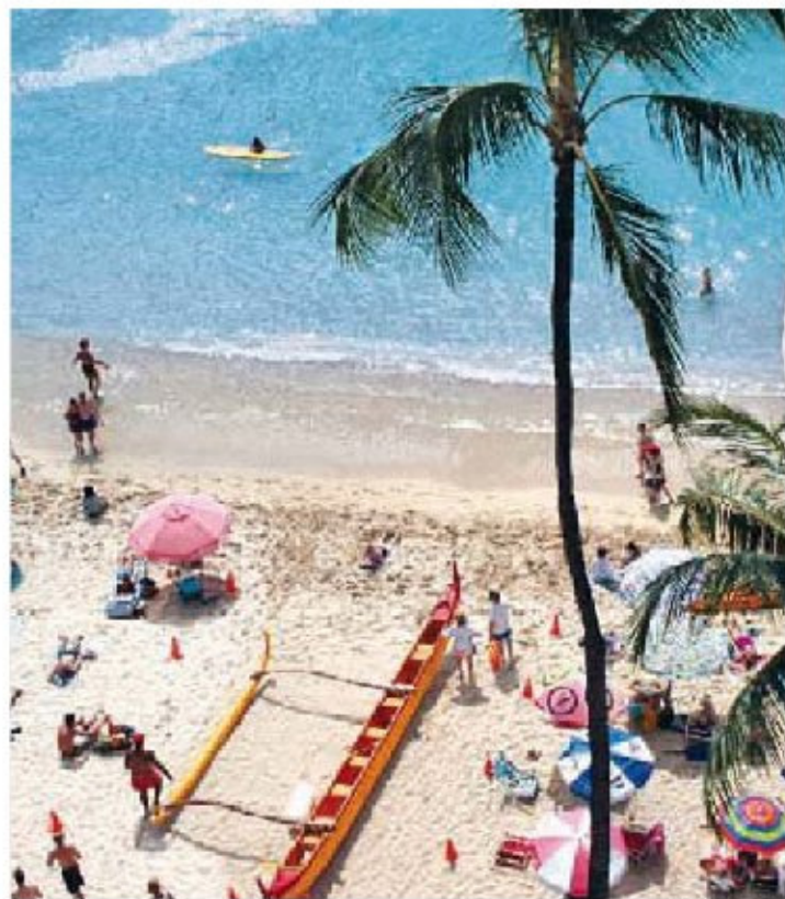
▲ Waikiki Beach