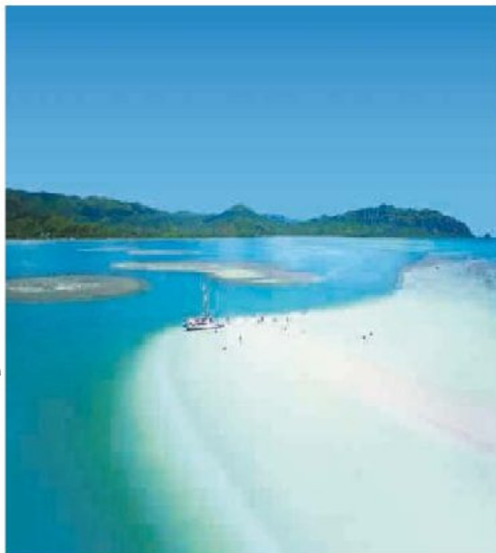
▲ Kaneohe Bay, Oahu